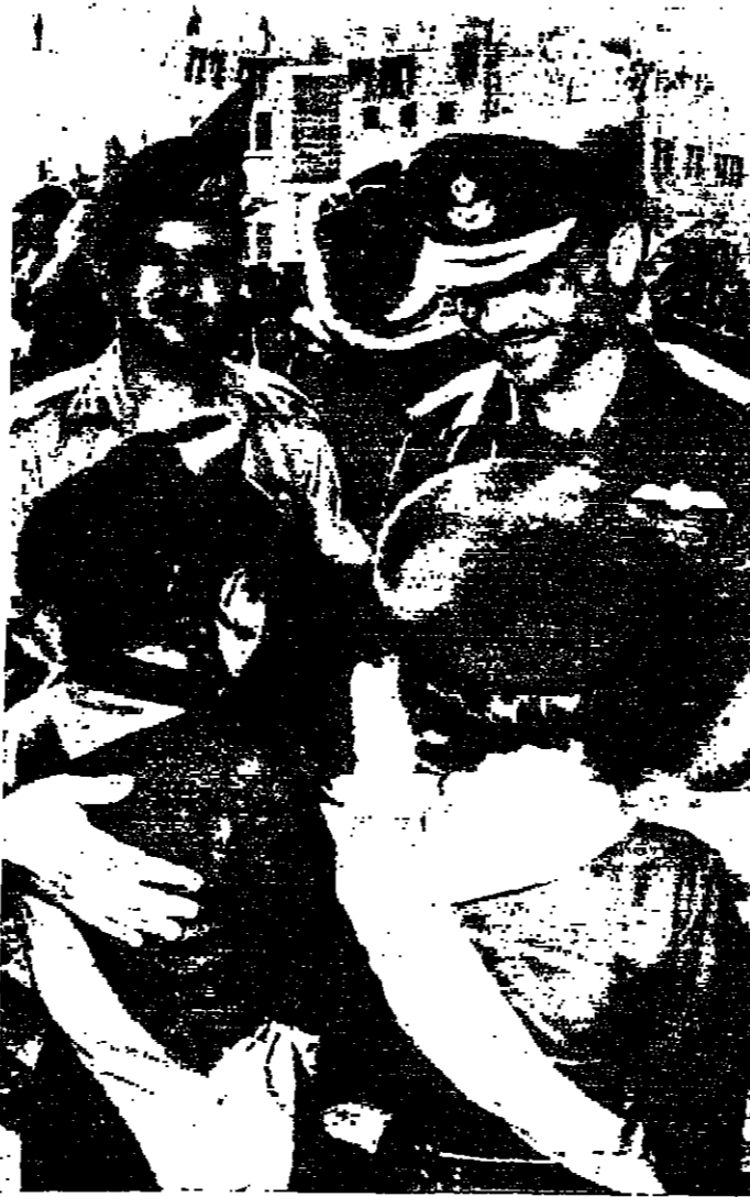
مفتان تقدمان باقتين من الزهور الى جلالة الملك العظيم لدى وصول جلالة الى مدينة عمان ( تصوير ١٠.١ )